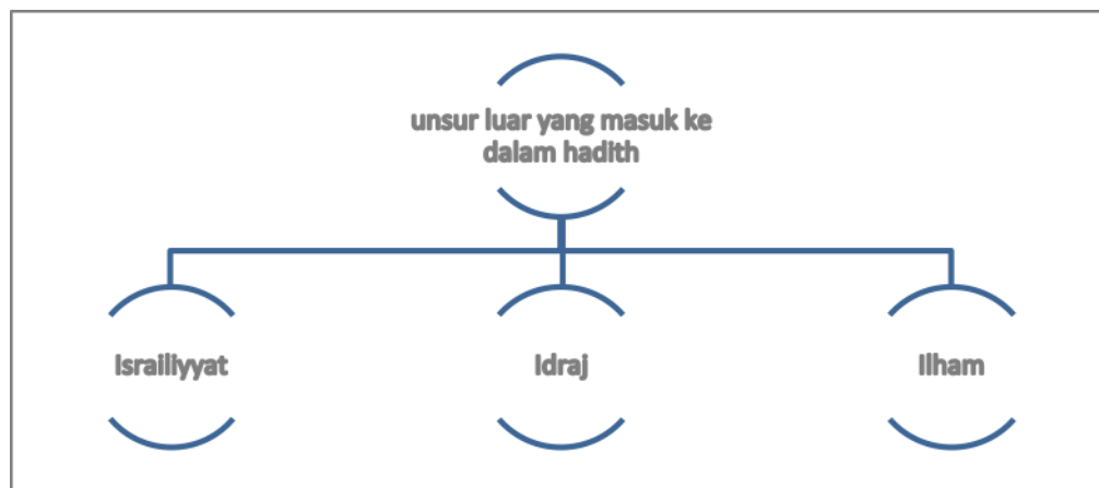
Unsur-unsur luaran yang kemungkinan terserap ke dalam matan hadith

Tiga ciri luaran yang disebut oleh Nursi perlu dibuang dari hadith selari dengan lima perkara yang digariskan oleh ahli hadith iaitu penambahan ke dalam matan; ilhām dan israiliyyat serta idraj .