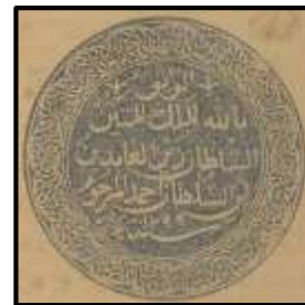
Rajah 1: Cap mohor Sultan Zainal Abidin III

keperibadian dan perwatakan baginda sebagai seorang sultan yang tegas, berkuasa dan mempunyai pendirian yang kukuh. Seterusnya, tahun 1299 hijrah yang terpahat pada baris akhir cap mohor tersebut merupakan tahun hijrah baginda menaiki takhta kerajaan negeri Terengganu Darul Iman, menggantikan al-marhum ayahanda baginda, Sultan Ahmad. Gambar cap mohor yang digunakan oleh Sultan Zainal Abidin III ini adalah sebagaimana Rajah 1.