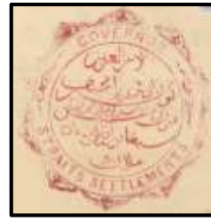
Rajah 3: Cap mohor Sir John Anderson K. C. M. G.

Rajah 3 juga menunjukkan cap mohor Tuan Yang Terutama Sir John Anderson K. C. M. G, yang dicap pada warkah kiriman beliau kepada Sultan Zainal Abidin III, dengan menggunakan dakwat merah. Cap mohor berbentuk bulat serta memiliki sepuluh kelopak ini mengandungi tulisan Rumi sekelilingnya, manakala di tengah-tengahnya pula terdapat tulisan Jawi sebanyak lima baris. Tulisan Rumi yang tertera pada cap mohor tersebut merupakan frasa “Governor Straits Settlements”, yang ditulis menggunakan huruf besar. Manakala frasa “Al-‘Izzu al-‘Aziz Governor dan Commander in Chief ada serta yang memerintah Starits serta Singapura Pulau Pinang dan Melaka” tertulis pada bahagian tengah bulatan cap mohor tersebut dalam tulisan Jawi.