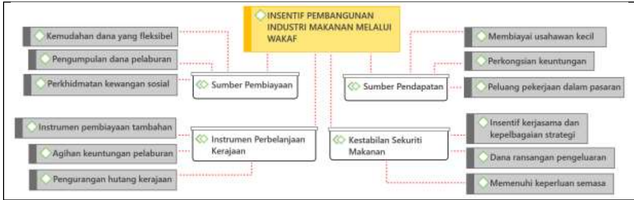
Rajah 1: Insentif Pembangunan Industri Makanan melalui Wakaf

Dengan ini, dapat disimpulkan melalui rajah 1 bahawa pelbagai insentif pembangunan industri makanan dapat dilihat kepentingan yang terhasil melalui wakaf. Antaranya ialah wakaf dilihat satu insentif sumber pembiayaan kepada industri makanan dengan fungsi kemudahan dana yang fleksibel, pengumpulan dana pelaburan yang berkesan serta alat perkhidmatan kewangan sosial yang baik. Selain itu, wakaf menjadi insentif kepada instrumen yang membantu kerajaan dalam perbelanjaan operasi dan pembangunan melalui pembiayaan tambahan dari wakaf, agihan keuntungan pelaburan daripada dana wakaf serta pengurangan hutang kerajaan apabila menerima dana wakaf yang berorientasikan kebajikan. Seterusnya, wakaf memberi insentif dalam meningkatkan sumber pendapatan dengan membiayai usahawan dari dana wakaf, agihan perkongsian keuntungan hasil wakaf serta peluang pekerjaan meningkat apabila pasaran semakin meluas. Akhirnya, wakaf memberi insentif kepada kestabilan sekuriti makanan apabila wakaf dijadikan sebagai insentif kerjasama dalam mempelbagaikan strategi pembangunan industri makanan, wakaf sebagai dana yang merangsang peningkatan pengeluaran makanan serta keperluan semasa dapat