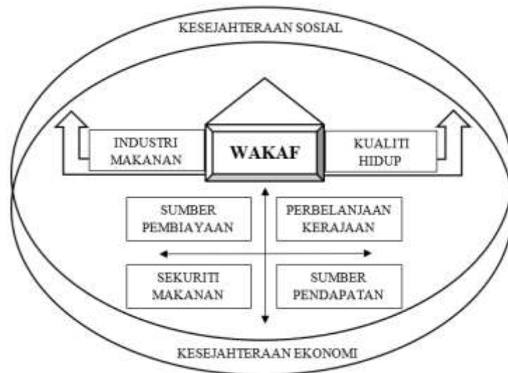
Rajah 2: Rangka kerja Peranan Wakaf dalam Industri Makanan sebagai Jaminan Kualiti Hidup

Model Waqf Trustee-Anchor Company-Community Farmer yang dicadangkan di dalam kajian Norfaridah et al. (2021) memberi peluang petani mendapatkan sumber pendapatan dan menambah pengetahuan berkaitan petani daripada syarikat yang bekerjasama dengan yang secara tidak langsung membuka peluang perniagaan yang lebih produktif. Kerjasama ini menambahkan juga dana wakaf yang seterusnya dapat membantu di dalam agihan pendapatan kepada masyarakat melalui kaedah wakaf. Model ini juga dapat membantu isu pemasaran hasil yang berkaitan dengan perniagaan tani. Justeru, ini menunjukkan peranan syarikat utama yang bukan sahaja membangun malah memasarkan atau menjual hasil tanaman atau ternakan dari tanah wakaf. Kitaran projek pertanian yang berlaku ini seiring dalam membantu kesejahteraan ekonomi.