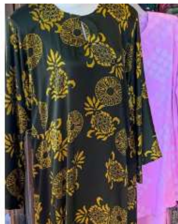
Rajah 3: Baju batik kaftan motif Ghazal Gambus (kiri) dan nanas (kanan)

Pengenalan motif segar dan unik mampu memberikan keistimewaan tersendiri kepada batik Malaysia, berbanding dengan batik dari