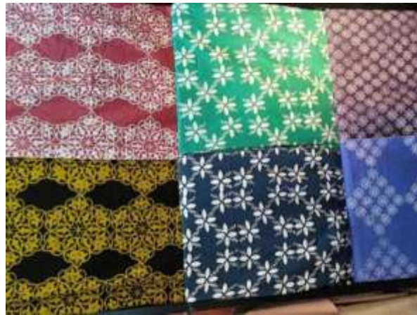
Rajah 1: Motif corak fauna yang digunakan untuk batik

membincangkan asal usul batik dari pelbagai perspektif. Batik adalah seni tradisional mewarnakan kain yang menggunakan lilin sebagai penghalang untuk melindungi bahagian tertentu kain daripada diwarnakan. Pembuatan batik melibatkan motif tradisional yang sering diilhamkan daripada unsur flora dan semula jadi. Unsur alam kemudiannya akan dikaitkan dengan falsafah hidup Melayu. Rajah 1 menunjukkan antara contoh motif corak fauna yang digunakan dalam penghasilan batik.